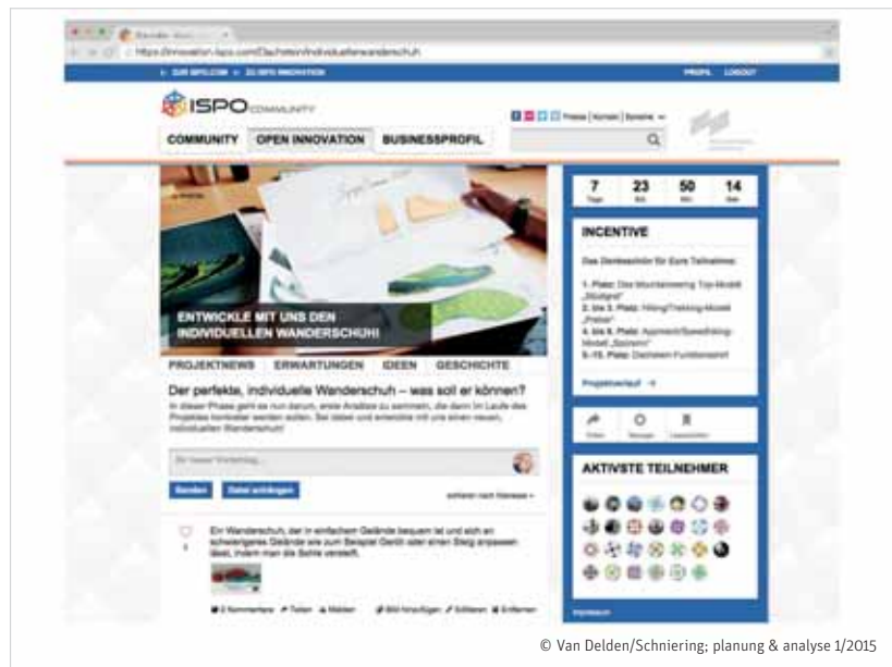
Abbildung 2: Unter innovation.ispo.com entwickeln Unternehmen der Sportindustrie neue Produkte und Dienstleistungen mit einer offenen Community.

So hat die Messe München als erste Messegesellschaft weltweit ihr Geschäftsmodell um die umfassenden Möglichkeiten von Crowdsourced Innovation erweitert. Für die weltweit führende Messe für die Sportindustrie, die ISPO, führte die Messegesellschaft im Jahr 2014 die Plattform ISPO Open Innovation ein, basierend auf der innosabi Crowdsourced Innovation Technologie . Hersteller und Händler der Sportindustrie können auf dieser Plattform weltweit mit Athleten, Sportfans und sportinteressierten Experten aus anderen Branchen zusammenarbeiten – und zwar entlang aller Phasen des Innovationsprozesses. So können beispielsweise in Co-Creation-Projekten gemeinsam innovative Produkte und Dienstleistungen entwickelt werden. Product-Testing-Projekte bieten Herstellern die Möglichkeit, Prototypen von Produkten oder Dienstleistungen schon vor der Markteinführung mit der Community zu testen und das Feedback unmittelbar mit den Anwendern zu